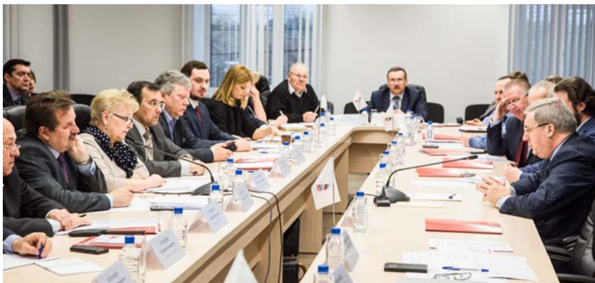
Заседание Совета Гражданской ассамблеи 28 апреля 2015 года