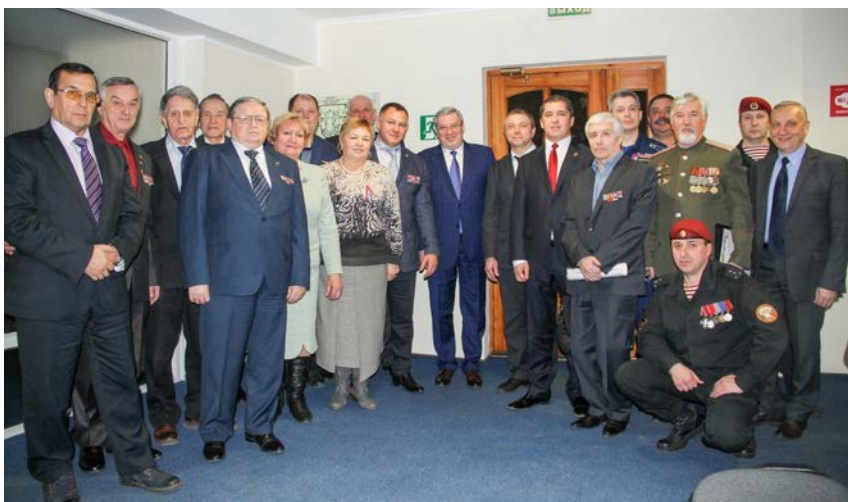
Встреча Общественной палаты ветеранов с Губернатором Красноярского края