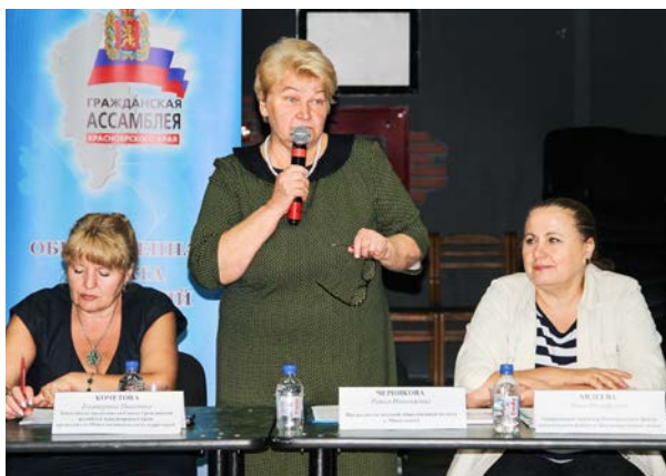
Выездное заседание ОП территорий в г. Минусинск, посвященное общественному контролю в сфере ЖКХ