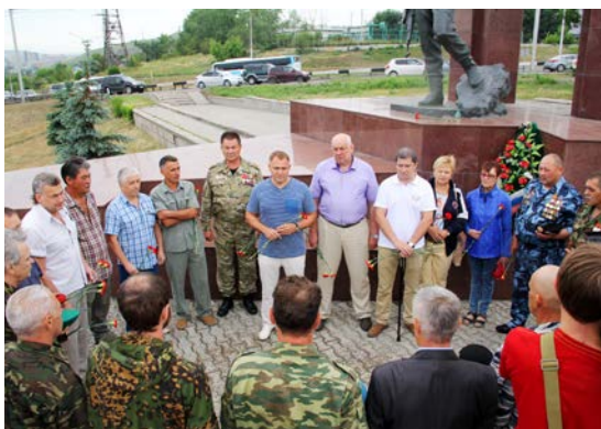
Общественная палата ветеранов, День памяти ветеранов боевых действий