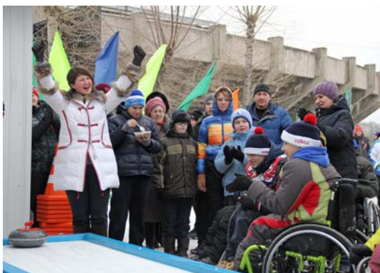
Общественная палата «Здоровый образ жизни, физическая культура и спорт», семинар «Современные подходы вовлечения в занятия физической культурой и спортом маломобильных групп населения»