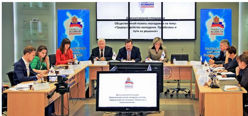
Общественная палата молодежи, дискуссионная площадка по проблемам трудоустройства молодежи