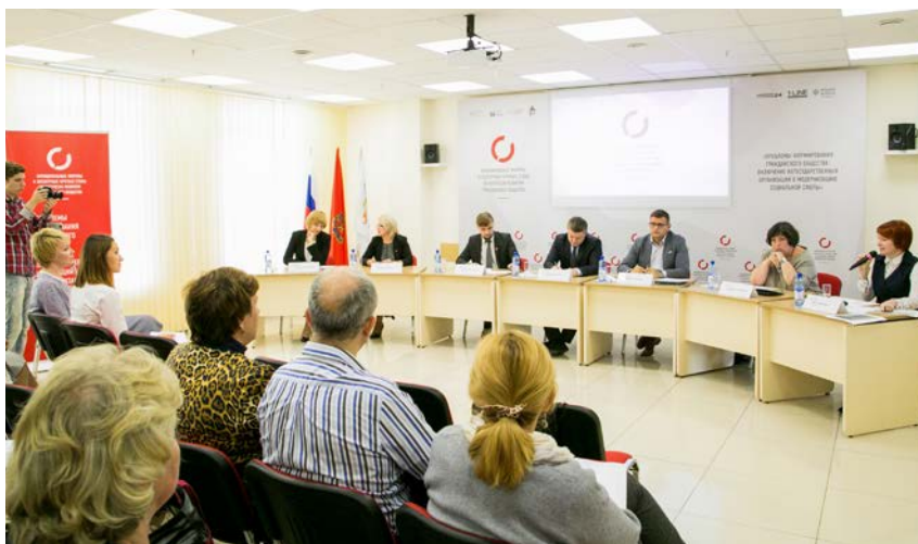
Экспертный круглый стол по вопросам развития гражданского общества, г. Красноярск, 2017 год