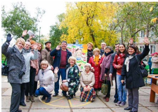
Социальный проект «Медиадесант», г. Красноярск, 2017 год