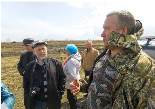
Выездная инспекция Общественной экологической палаты на свинокомплекс «Красноярский»