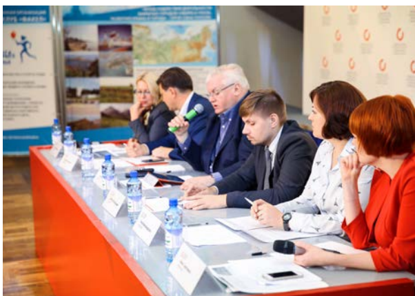
Муниципальный форум и экспертные круглые столы в ЗАТО Железнодорожск