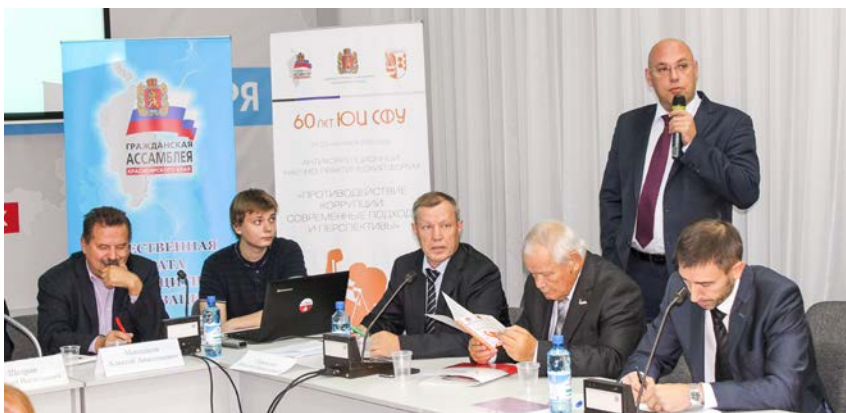
Общественная палата правозащитных организаций, Антикоррупционный научно-практический форум