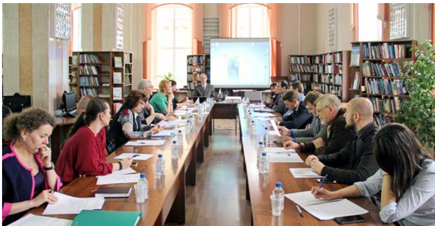
Общественная палата образовательных и просветительских организаций, круглый стол «Российский взгляд на семейную политику: мифы и угрозы ювенальной юстиции. Приглашение к разговору»