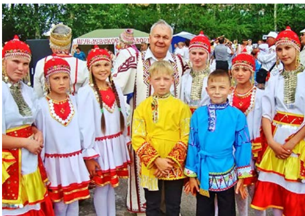
Общественная палата национальностей, Чувашский национально- культурный праздник «Акадуй»