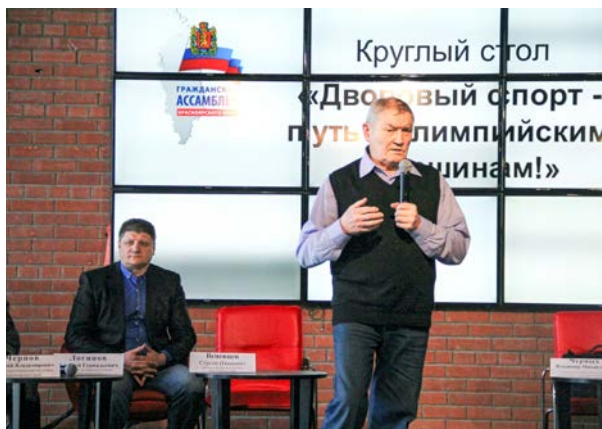
Общественная палата «Здоровый образ жизни, физическая культура и спорт», круглый стол «Дворовый спорт — путь к олимпийским вершинам»