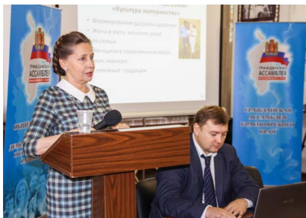
Общественная палата демографического и социального развития, конференция «Дети Красноярского края, настоящее и будущее»