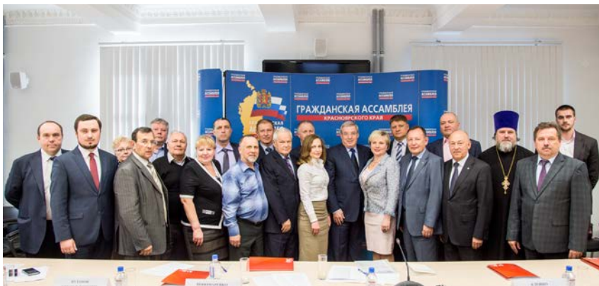
Первое заседание Совета Гражданской ассамблеи IV созыва