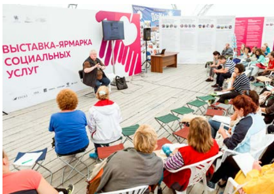
Ярмарка - выставка социальных услуг. Летний гражданский форум, 2017 год