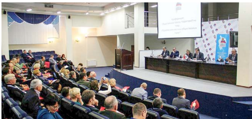
Конференция Общественной палаты территорий «Развитие сети местных общественных палат»