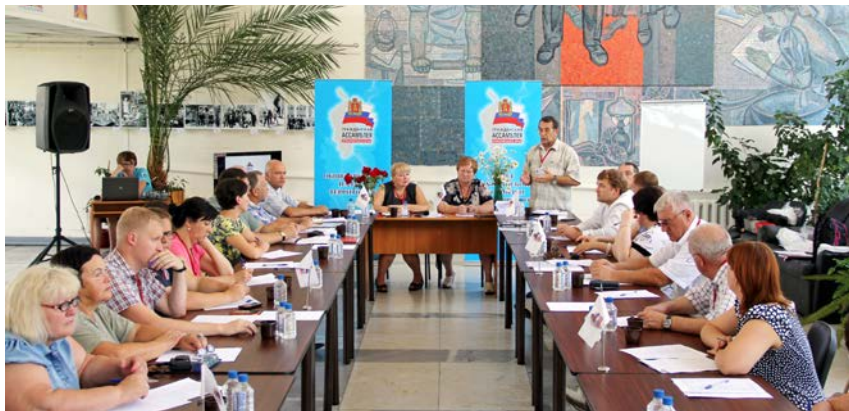
Выездное заседание Общественной палаты территорий в пгт Шушенское