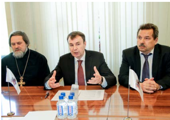
Встреча с министром экономического развития и инвестиционной политики Красноярского края В.В. Зубаревым